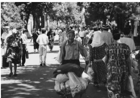
サマルカンドの目抜き通り

系民族の一部がウズベク人で、14世紀にはほぼ現在の国家の骨格を創ったのは英雄、アミル・チムールだと言われています。チムール帝国の首都、サマルカンドは今もその時代の繁栄の跡をとどめています。首都タシケントは人口220万人を超える中央アジア最大の都市です。1968年の大地震によって市街地のほとんどが壊滅しましたが、旧ソ連による復興とインフラ整備が進み、今日では数路線の地下鉄も有する近代的大都市です。