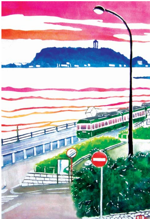
夕さり ～鎌倉高校前～ 丸山晶子（昭和63年卒業）