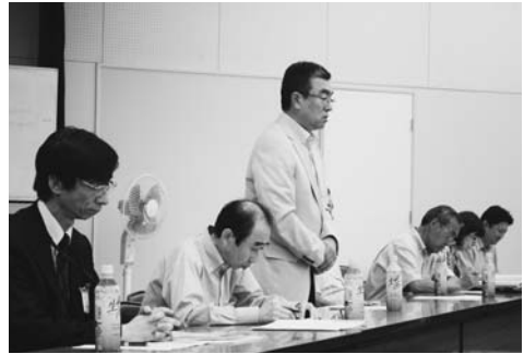
写真は昨年6月の様子

議 事：(1) 平成23年度事業報告について (2) 平成23年度会計決算報告について (3) 平成23年度会計監査報告について (4) 平成24年度事業計画案について (5) 平成24年度会計予算案について (6) 平成24年度・平成25年度 役員について (7) その他