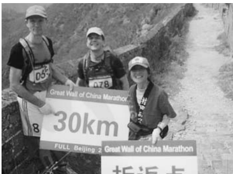
万里の長城マラソン

ン」に参加した後、山村を一人旅しました。今までいろんな国を「英語」で歩いていたので中国語ができなくても何とかなると思ってきました。とんでもなかったです。手ぶり、身振りで四苦八苦。出租(タクシー)、住宿でポッタくられてしまった。落ち込んでいたところ親切な民宿のご夫婦に巡り会い手作りのほかほか包子をぱくつくくと身体も心もポカポカになった。帰国してすぐ公民館の「中国語クラス」に入りラジオ講座も聞き始めました。一年後、再度「長上マラソン」に参加し、あ