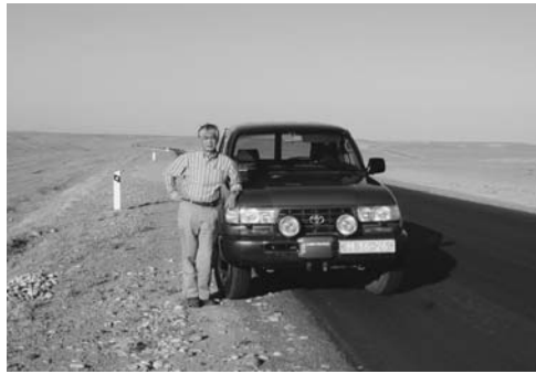
シルタン現場に向かう土漠の一本道

フエルガナとは同じ国とは思えないほど過酷な自然条件と人里から隔離された環境の中で建設は進みました。ドイツ、イタリア、日本の各企業による国際コンソーシアム運営の難しさもありました。滞在中の最大の楽しみは、たまの休日に車で4時間ほどのサマルカンドやブハラといったシルクロードの古都を訪ねることでした。多くの困難と障害を乗り越えて最終的にプラントは完成し、無事に客先に引き渡すことが出来ました。