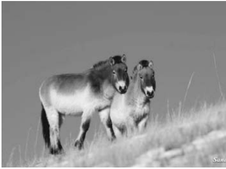
野生復帰したモウコノウマ

人のちから感染症対策に特に興味を持ち、モンゴル国に没頭しています。 2004年にモンゴル国立農業大学から招聘教授、2006年にモンゴル健康科学大学から客員教授の称号を授与していただいたのを機会に、ウランバートル人、遊牧民、競馬関係者、野生動物生態関係者などのたくさん仲間ができ、特に遊牧民からいただいた2頭のモウコノウマは私の帰りを待っています。 この頃から野外調査にはランドクルーザーを使うだけでなく、遊牧民のゲルに宿泊し、遊