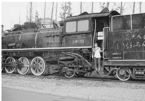
大連交通大学 キャンパス

日本人には中国嫌が多いけれどそれは多分に偏見です。日本人よりも親しみやすいです。「二回生、二回熟」という諺があります。初めはとっつきにくいけど2回目はすぐ溶け込むという意味です。ほんとに言い得て妙もともと上手になって日中間の友好のボランティアをするのが夢です。