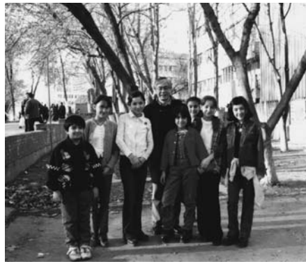
タシケントの子供たち

いた風が通り過ぎます。秋には日本と同様に森林や街路樹が橙色に染まります。果物は初夏の苺とさくらんぼに始まり、夏のメロンと西瓜、秋の柿、冬の蜜柑がバザールに山積みされ、ほとんど一年中季節の味には事欠きません。