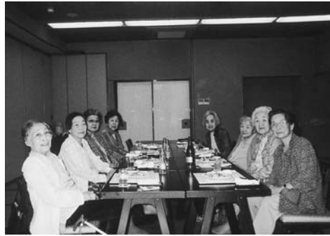
クラス会 かいひん荘

耳の遠い方は近くに寄って大きな声でお話をする人、隣り同士でお話をしないと聴こえない方、また杖持参の方々、でも皆さんとても元気でした。88歳に