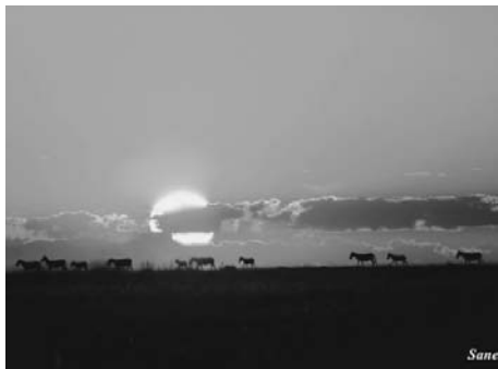
気まま(野生の口バ)

よく言われているように携帯のメールやパソコンの使用では言葉(漢字)は憶えないし、車に乗ればカーナビの教えてくれ