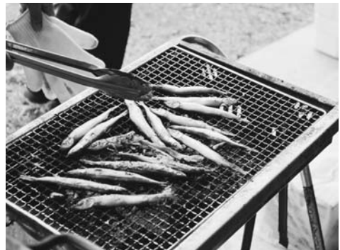
昨年6月の記念撮影