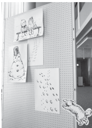
佐々木明日香 40 回生 イラスト展