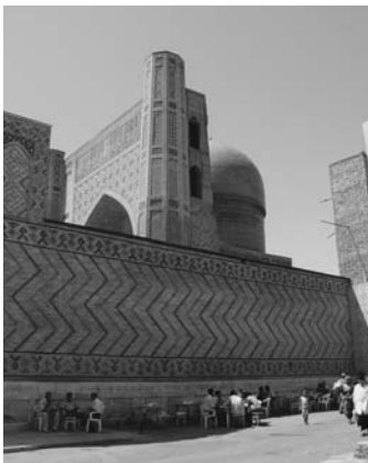
ブハラの旧市街一本道